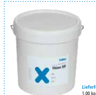
Lieferform 1,00 kg Triflex Thixo SD

Triflex Stone Design S – auch chargenreine Lieferungen – miteinander vermischen (siehe Punkt 5 „Verarbeitungsanleitung Fläche“).