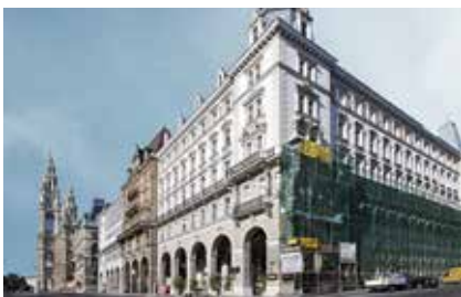
Bürogeb. Rathausplatz, Wien