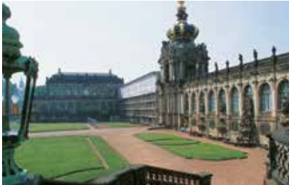
Dresdner Zwinger, Dresden