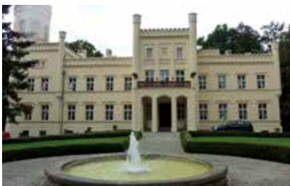
Schlosshotel Palac Mierzecin