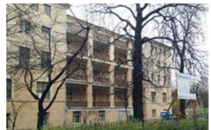
Kita Waldemar, Berlin