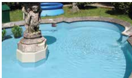
Fontana Villa Magni