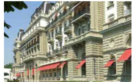
Grand Hotel National, Luzern