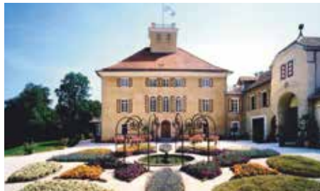
Schloss Fachsenfeld, Aalen